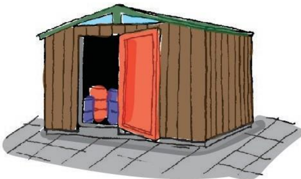
Lukket skur med impermeabelt underlag med opkant ved døråbning